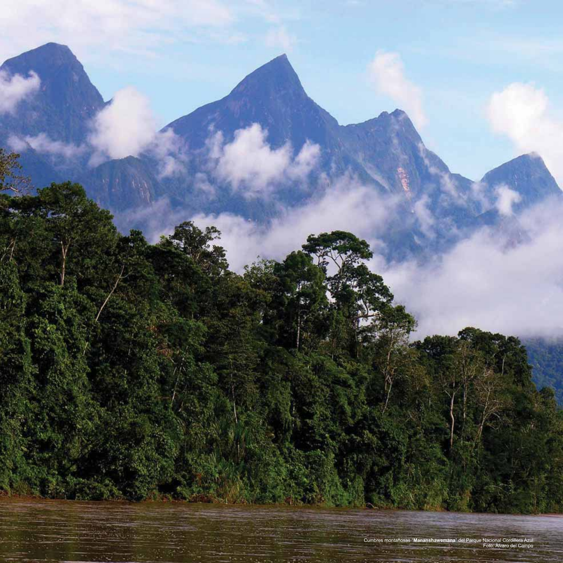
Cumbres montañosas "Mananshawemana" del Parque Nacional Cordillera Azul